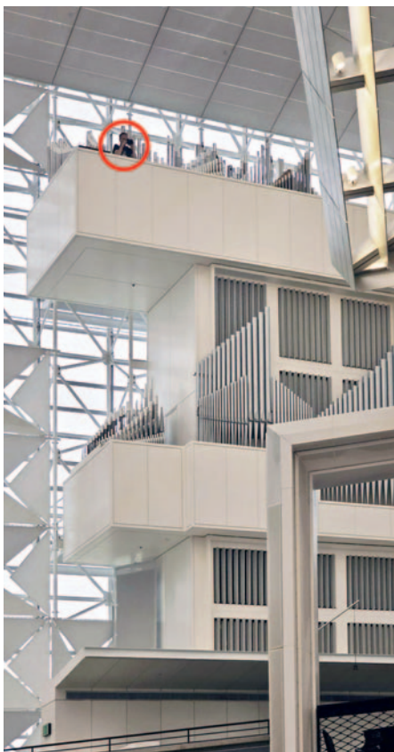
Garden Grove (USA), Christ Cathedral: Der Fotograf in Aktion ... und das Resultat

Bei so mancher Fotoaktion entdeckte ich Kuriositäten und ‚Spezial-Register‘, wie z. B. ‚Loss jon‘ am Spieltisch der Langhausorgel des Kölner Doms oder ‚O'zapft is!‘ an der Luzerner Hoforgel (Abb. auf der linken Seite). Was es damit auf sich hat, verrate ich im Buch. Die geheimen Wein- oder Whiskyfächer in so mancher Orgel zeige ich lieber nicht.