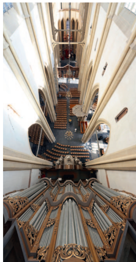
Sint Nicolas Bovenkerk in Kampen (Niederlande): Für solche Aufnahmen in luftiger Höhe braucht man starke Nerven.

Auch die Ausrüstung ist mit hohen Kosten verbunden: Alle paar Jahre muss ich neues Equipment kaufen. Erstens schreitet die technische Entwicklung immer weiter voran, was sich insbesondere in der Bildqualität bei schlechten Lichtverhältnissen zeigt, die man in Kirchen leider oft vorfindet. Zweitens verschleßen die Kameras durch die vielen Reisen und den intensiven Einsatz mit ständigen Objektivwechseln so schnell, dass ich hier etwa alle fünf Jahre einen fünfstelligen Betrag investieren muss. Aktuell fotografiere ich mit zwei Canon EOS R5 spiegellosen Kameras und einigen Objektiven – Zooms und Festbrennweiten – vom 7,5 mm Fish-